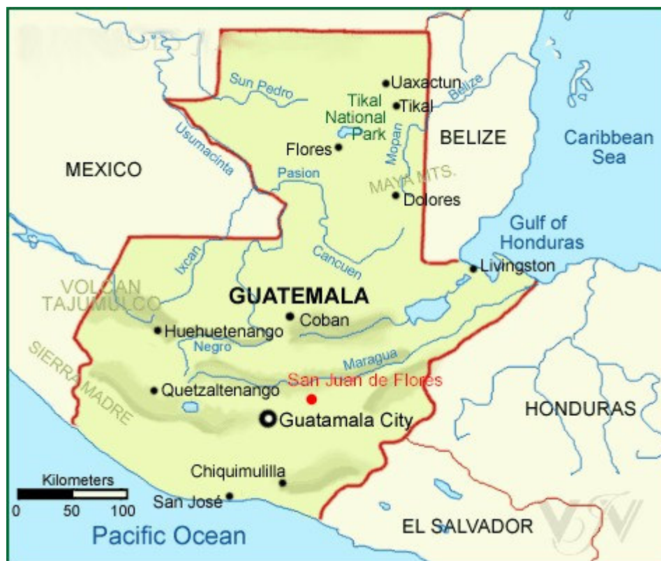
figuur 1.1 – geografische ligging van San Juan de Flores

San Juan beschikt over een kliniek en een dorpscentrum waar verschillende activiteiten plaatsvinden (vergaderingen, feesten et cetera). Verder is er een kerk, een kleuterschool en een lagere en middelbare school (het Colegio). De bewoners werkten zelf mee aan de bouw van deze gebouwen. Met de weinige middelen die er zijn, proberen zij de levensomstandigheden te verbeteren en daar waar nodig helpen de mensen elkaar.