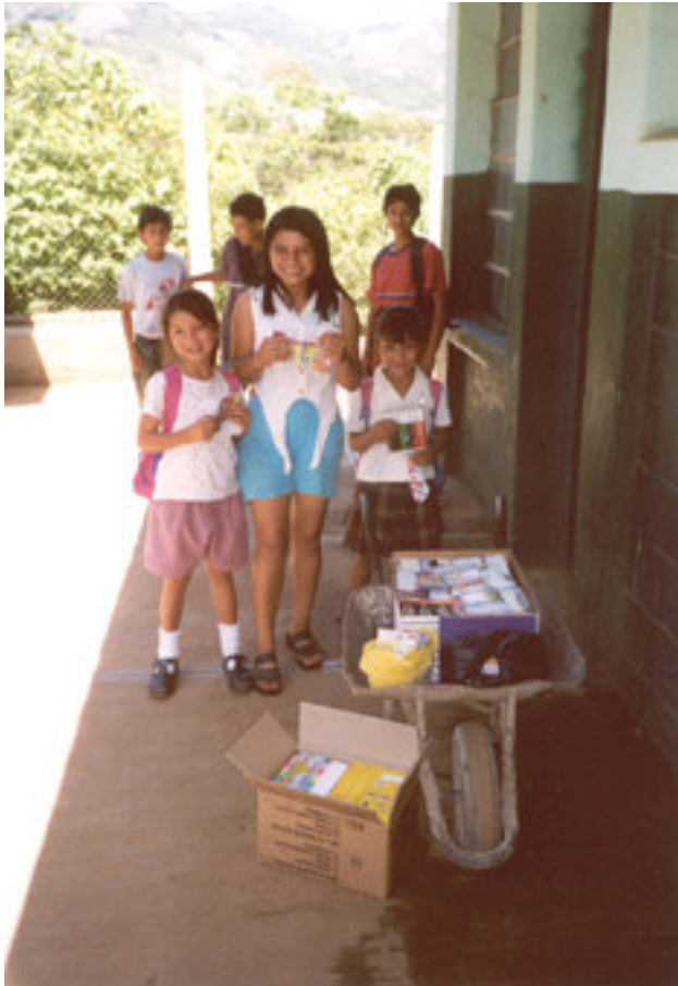
foto 1.5 - kruiwagen met materiaal