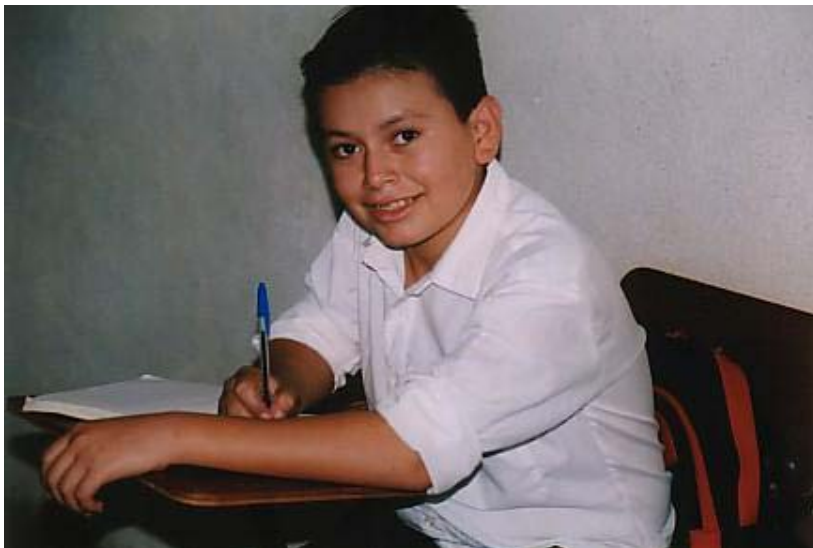
Foto 3.1 – leerling van het Colegio aan het werk op een nieuwe lessenaar

In 2001 heeft het Colegio door financiële steun van de Stichting schoolmeubilair en studiematerialen kunnen aanschaffen. De 30 lessenaars, een bureau en een kast zijn inmiddels al bijna een jaar in gebruik.